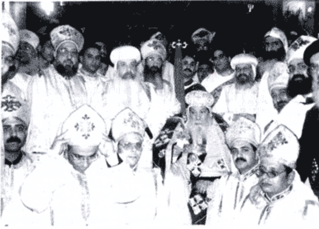
كاهننا على مذبح كنيسة الشهيد مار جرجس ومارمينا - بصول المنبح.